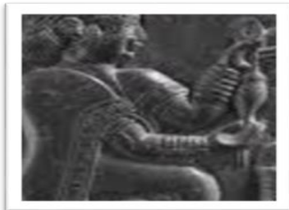
شكل (5) المغزل اليدوي

نصرت الملوك مصباح اردكاني ابوالقاسم دادور، نقش مايه زن مهرهاى ايران، ص168.