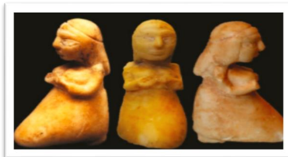
شكل رقم (2) تمثال من الرخام الأبيض

Elizabeth Carter, Holley Pittman, Matthew W. stolper, Protoliterate Susa (The Royal City of Susa) , p.59.