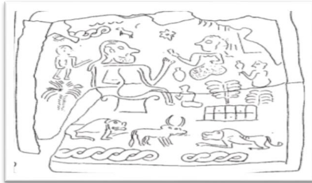
شكل رقم (3)

Aurelie Daems, The iconography of women in pre-Islamic Iran, p.22.