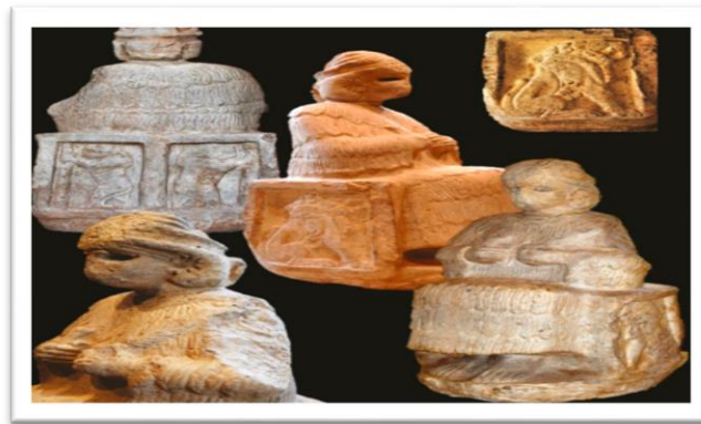
شكل رقم (1) الإلهة (ناروندي) Narundi مجيد زاده، تاريخ وتمدن ايلام، ص122.