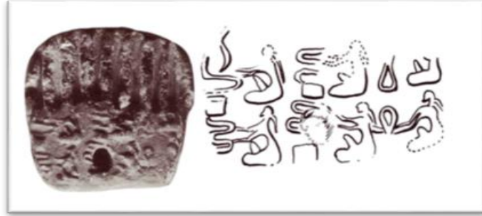
رقم (6) نساء في عملية غزل صباح اسطيفان كجه جي، الصناعة في تاريخ وادي الرافدين، ص50.