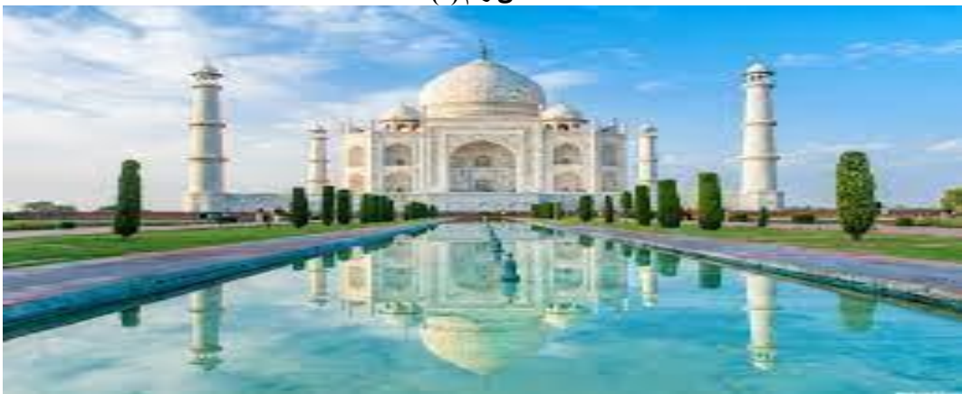
تاج محل من الخارج